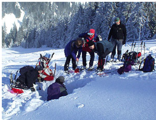
Ausbildung am Schneeprofil

Von der Emser Hütte ging es nun hinauf zur Hohen Kugel (1645 m). Der strahlende Sonnenschein und die Fernsicht über die Hochnebeldecke in den Tälern, liessen die Kälte zumindest zeitweise vergessen.