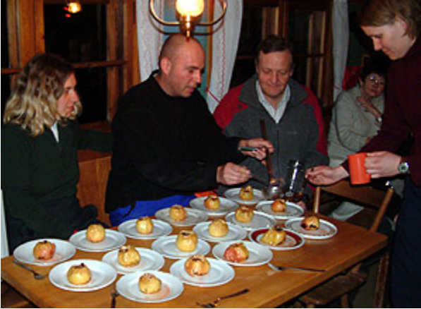
beim Bratapfel flambieren

Am Abend wurden alle mit kulinarischen Köstlichkeiten für die Mühen der Tour belohnt. Eine Schneebar vor der Hütte sorgte dafür, daß auch die Kameradschaft nicht zu kurz kam.